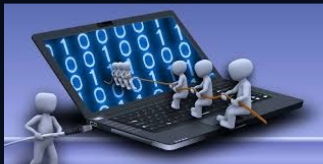
En colaboración con grupos GIR-UVa