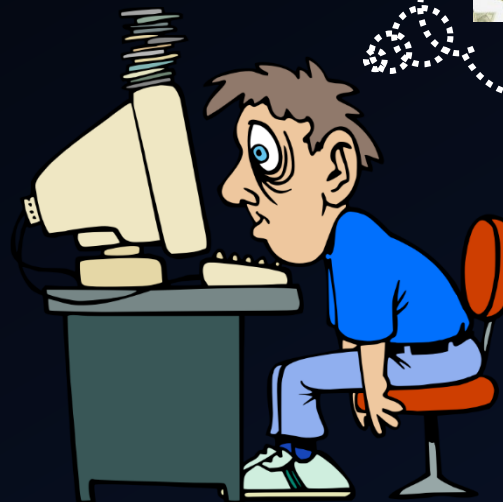
En convenio con empresas